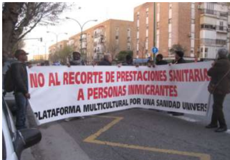
Bilde 5, 6, 7. ”No al recorte de prestaciones sanitaria a personas inmigrantes” (Nei til kutt i helsetilbud til innvandrere)