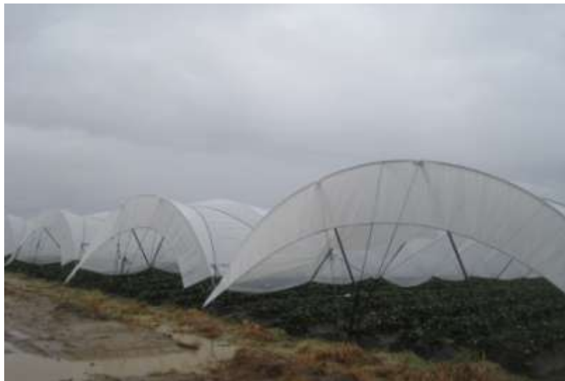
Bilde 1. Strawberry fields