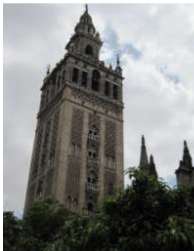
Bilde 2. Giralda i Sevilla

Spania er så mangt: Landet som er blitt hjem for tusenvis av ”klimaflyktninger” fra Norge, landet som aldri slutter å fascinere oss med sin historie, befolkningssammensetning, natur, mat, klima og musikk, og landet som gjennom århundrer har vært møteplass for forskjellige folkegrupper og religioner.. I tillegg til romersk tilstedeværelse, var halvøya underlagt muslimsk (maurisk) herredømme i nærmere åtte hundre år. Hovedstaden Cordoba var et blomstrende sentrum i Europa innen vitenskap og kunst. I dag kan man beundre restene av vidunderlig maurisk arkitektur, slik som Giralda i Sevilla; en tidligere moské, nå katedral og et symbol på subtil skjønnhet fra forgangne tider.